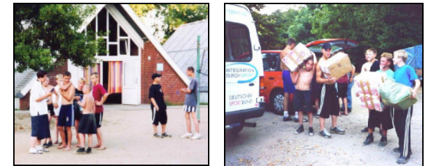
Sommer 2003- Straßenkinder aus Kruglowo erleben Ferien in Falkenstein

Informationen und durch Schaffung unmittelbarer Verbindungen zwischen Menschen aller Berufe sowie Vertretern des kulturellen, gesellschaftlichen und wirtschaftlichen Lebens (aus der Satzung unserer Gesellschaft).